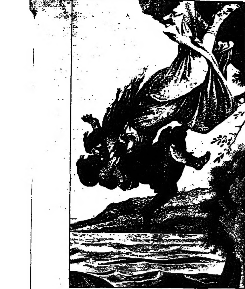
الانتصار غرقاً شهد رواجاً كبيراً في القرن الثامن عشر

في مقال خلط الحيات ، ونكر يستدل أنه مؤلف «نصف ذبانية» كتب لا يلبس بها في موضوع «السلام» ، إلا أنه لم يجد ناثراً لها . وختم مقالة قائلا : « لا أريد ازهازا على نعشى ، ولا احتفالا بعبثي . هذه الطوقس كلها تزجني ، لاني رحلت لاقوم بماغمم تحقيق حلم به محال في العالم» . الانتصار فنون ! اثبت الوثائق ان المنتصرين انواع ، منهم الحرص على الترتيب ، ينظم أعماله ويصف نيابه واحييته ، ويصف تفاصيل ماشه قبل أن يرحل ، ومنهم العكشي يترك الغار مفتوحا ، والخبيل يحرس على أن لا يبدوا فيباه ، والمجن يتخذ وضعا حكما ، والصدور يقل شخصين أو ثلاثة قبل أن يسوت . في ١٥ تموز ١٩٤٩ انتصر مرسيل جنين غرقاً لإن رئيس الجمهورية الفرنسية طرزه من السجن ، ولم يجد سقا له في الحياة المرة . واقتدى به الالائي والفرنكوف ، نشنن نفسه في اليوم التالي لاطلاق سراحه من السجن . جان بواريه ، المزارع في منطقة انسان لوس ، الفرنسية ، شفق نفسه في مطبخه فوق تاوتب الشراة منذ خمسة عشر عاما . . . وتك ٧٠ الف فرنك ورسالة كتبت ليا وفاته وأرسله للشر قبل انتحاره ، قال : « قتلت نفسي بزمه ارادي في ٢٥ ايلول ١٩٥٢ » . واكتفي بهذا القبر بين الأشخ . ويعلم أول لوس كان محررا ديبلوماسية في جريدة «يوريوك دايلي نيوز» ، وكتب مقالة الأخيرة مقال فيها : « هذا مقالتي الأخير كتبه في حياتي الصحافية الطويلة . اته القتال ٨٧٠٠ وان كتب سواء ، لاني انتحرت أنني ، وقد قربت أن كتب بخط يدي ليا وفاتي لاني أوفد الناس خيرة في هذا الموضوع ، وأود أن يكون هذا القبر شريفا